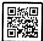
สมัครออนไลน์